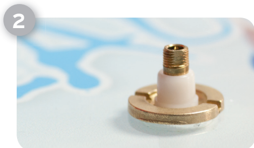
Hier werden die Zeiger aufgesteckt. Es ist kein Werkzeug notwendig!