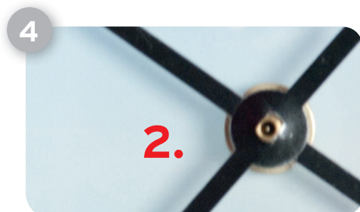
Achten Sie beim Minutenzeiger (2) besonders auf die Form der Zeigerwelle. Diese ist an zwei Stellen abgeflacht, wodurch sich der Minutenzeiger nur in einer bestimmten Position aufstecken lässt (leichter Kraftaufwand ist notwendig).