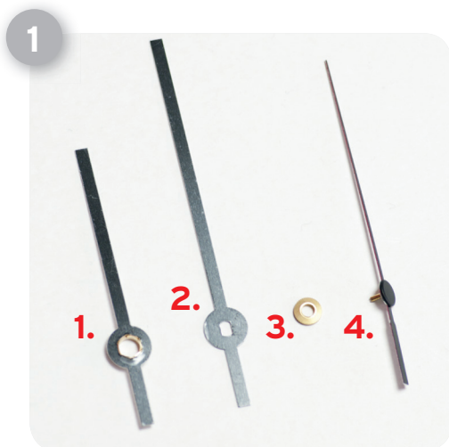
Reihenfolge der Zeiger wie sie auf der Uhr montiert werden.